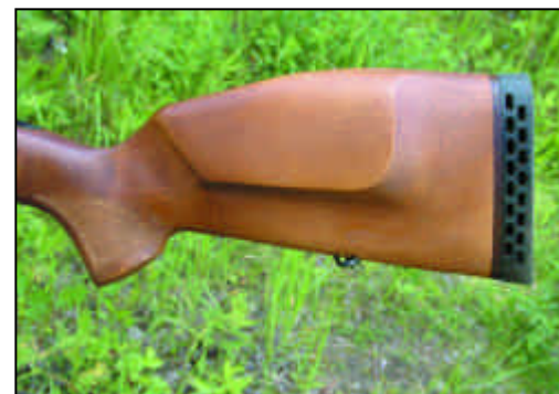
Приклад Хорошо видна щека приклада Резиновый амортизатор

Долгие годы отечественные охотники располагали только одним, сравнительно мощным, патроном для охот на крупных копытных и медведя - это 7,62x54R. При всех его достоинствах, многие отмечали недостаточное его останавливающее действие, особенно на близких расстояниях. Ничего тут не поделаешь - средний калибр 7,62 мм имеет пределы своих возможностей. Поэтому, в 1955 г М.Н. Блюм разработал на его базе патрон крупного калибра, 9x54R. Он сразу же нашел применение в карабинах с ручной перезарядкой "Лось", КО-9, штуцерах и комбинированных ружьях МЦ, а также полуавтомате "Медведь" (на базе СВД). Несмотря на несколько меньшую мощность, чем базовый 7,62x54R и меньшую начальную скорость пули, новый патрон быстро стал популярным ввиду большего останавливающего действия. Несмотря на это, патрон имеет довольно крутую траекторию полета пули, что ограничивает его применение дистанцией 200 м. Это стало причиной его критики в охотничьей литературе. К сожалению, в 1970-х годах было принято решение о снятии этого патрона с производства. Так, в 1973 г был прекращен выпуск "Медведей", а в 1976 г "Лосей" под этот патрон. В принципе, этот патрон является промежуточное положение между