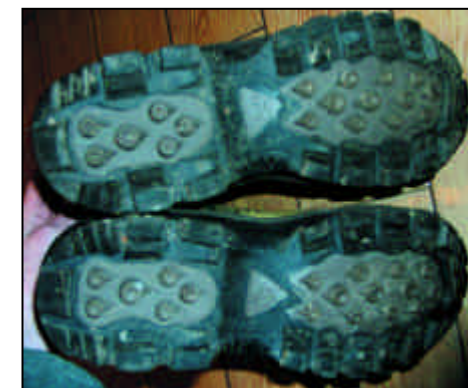
Rocky BuckStalker™ модель FQ 7792

Еще одна интересная особенность. Человеческий запах уничто-