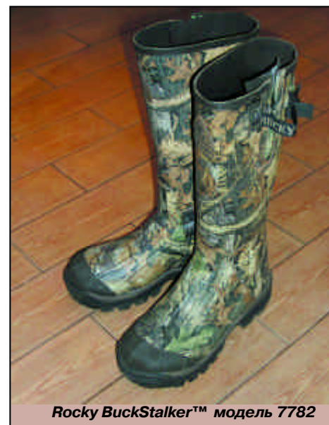
Rocky BuckStalker™ модель 7782

(CamLok), работающий по принципу "крокодильчика" от подтяжек.