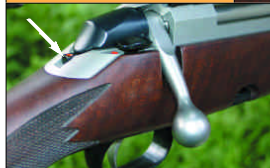
Указатель взвода курка и предохранитель