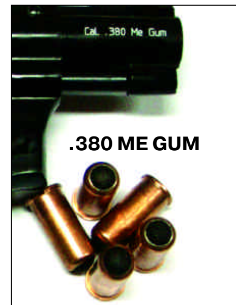
.380 ME GUM

Отстрел же патронов по статическим деформирующимся или разрушающимся мишеням (пластилин, желатин, бумага) мало что дает для исследования останавливающего (шокового) воздействия патронов. Ведь конечным результатом применения оружия самообороны должно быть лишение возможности нападения,